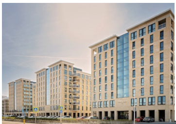
Vondelparck, Leeuwarden 2022 nieuwbouw appartemententorens