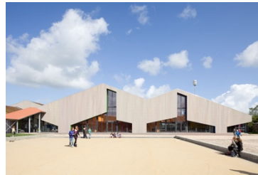
MFC It Spectrum, Burdaard 2011 nieuwbouw Multifunctioneel centrum