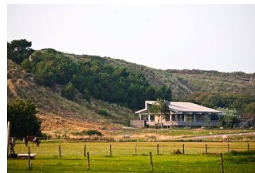
Duinvilla, Vlieland 2009 nieuwbouw vrijstaande woning