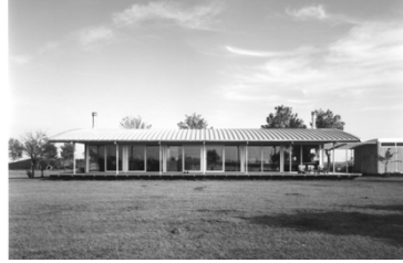
Woonhuis, Gaastmeer 1998 nieuwbouw woning