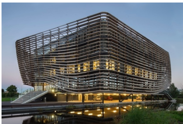
Watercampus, Leeuwarden 2015 nieuwbouw kantoor