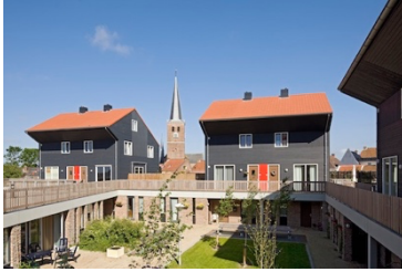
Offingaburg, Hallum 2009 nieuwbouw combinatie gezinswoningen en zorgappartementen