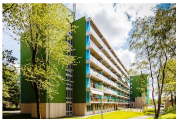
Abbingahiem, Leeuwarden 2014 renovatie en aanbouw seniorenwoningen